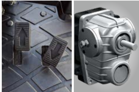
Mehanički i hidrostatski (HST) mjenjači

Podesivo sjedalo sa suspenzijom omogućuje korisniku komforan rad u bilo kojoj prilici čak i nakon višesatnog rada. Sigurnosni pojas na uvlačenje dio je standardne opreme svakog Kioti traktora.