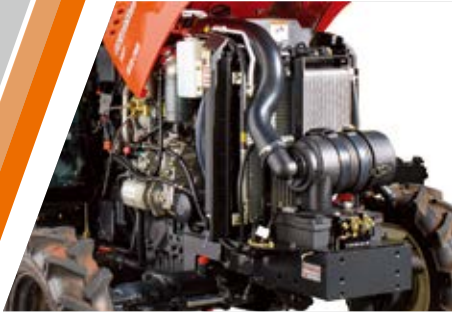
Dvostruki zračni filter (opcija)

Izdržljivi traktori visokih performansi uljepšati će Vam svaki radni dan!