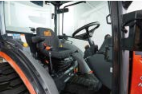
Deluxe sjedalo s suspenzijom i naslonima za ruke

Sa hidrauličnim volanom savladat ćete učestalo i intenzivno zakretanje kotača uz minimalan napor. Podešavanje volana omogućuje svakom korisniku namještanje vlastite idealne pozicije.