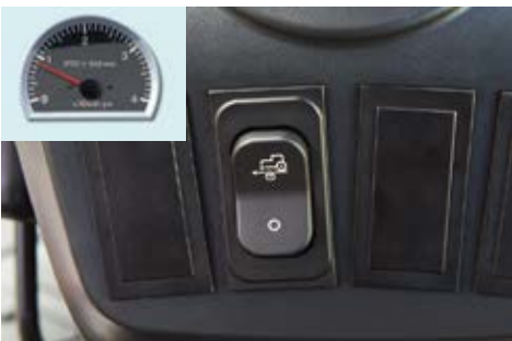
HST Cruise tempomat (standardno za HST modele)

Kada je "Vežani HST" uključen pedala HST pogona je sinkronizirana sa okretajima motora. Pritiskom na jednu od pedala povećavaju se okretaji i potrebna snaga da savlada veće opterećenje. Na taj se način smanjuje potrošnja goriva i pojednostavljuje upravljanje traktora, posebice sa prednjim utovarivačem ali i brojnim drugim priključcima.