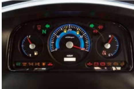
Osvjetljena kontrolna ploča

Dvostruki zračni filter omogućuje pojačanu filtraciju kod rada u suhim i prašnjavim uvjetima te produžuje vijek trajanja samog filtera.