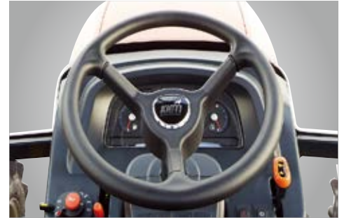
Podesivi hidraulični servo volan

Osvjetljena kontrolna ploča osigurava vrlo dobru vidljivost pri svim radnim uvjetima - danju i noću.