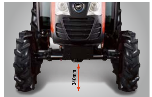
Visoka udaljenost od tla (klirens)

Svi modeli dolaze standardno opremljeni sa dva para hidrauličnih izvoda (4 ventila) što omogućuje širok izbor priključaka i dodatne opreme.